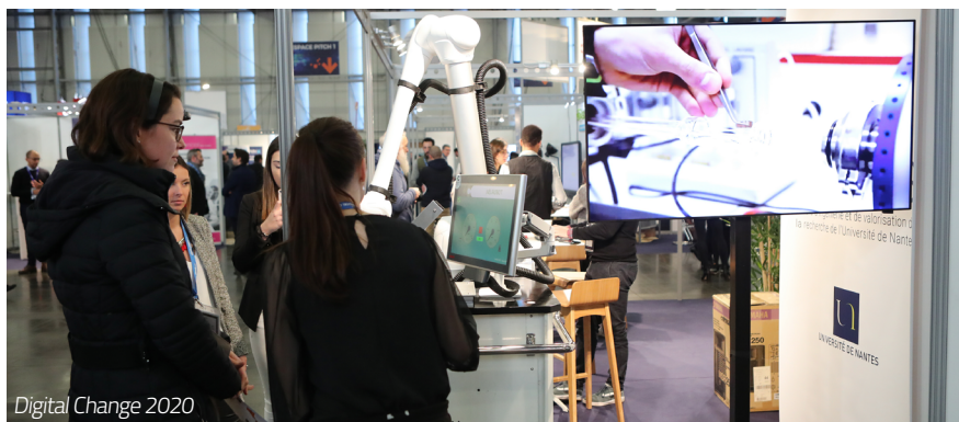
Digital Change 2020

À l'heure de la crise sanitaire, la transformation du numérique et l'évolution des métiers sont au cœur des enjeux des entreprises de la filière. L'événement Digital Change, consacré à la transformation numérique des entreprises et de l'économie, revient au Parc des Expositions de Nantes les 29 et 30 septembre 2021 et rassemblera dirigeants et cadres du grand Ouest. Partage d'expériences, découverte de solutions et valorisation de réussites seront au programme de cette 5 ème édition. Les interventions inspirantes de l'événement ont imposé Digital Change comme une référence sur les sujets de mutations digitales stratégiques des entreprises. Dans le contexte de confinement et de fermeture des activités, l'e-commerce devient un outil clé pour maintenir les activités de vente, que cela soit en b2b ou b2c. Encore faut-il utiliser à bon escient ce canal de vente et trouver les réglages qui correspondent à ses produits et à ses canaux historiques de distribution.