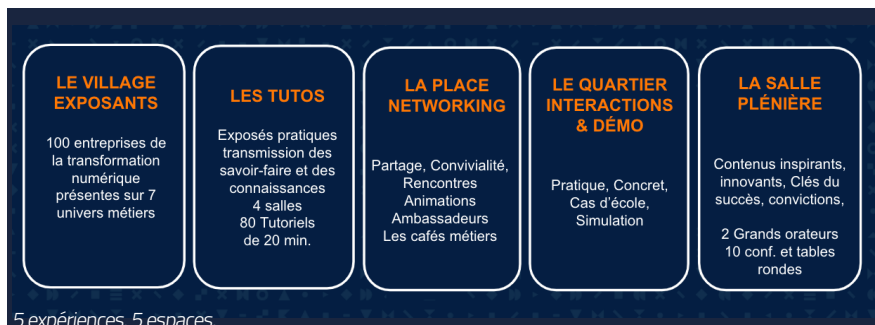
5 expériences, 5 espaces.