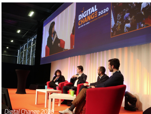
Digital Change 2020